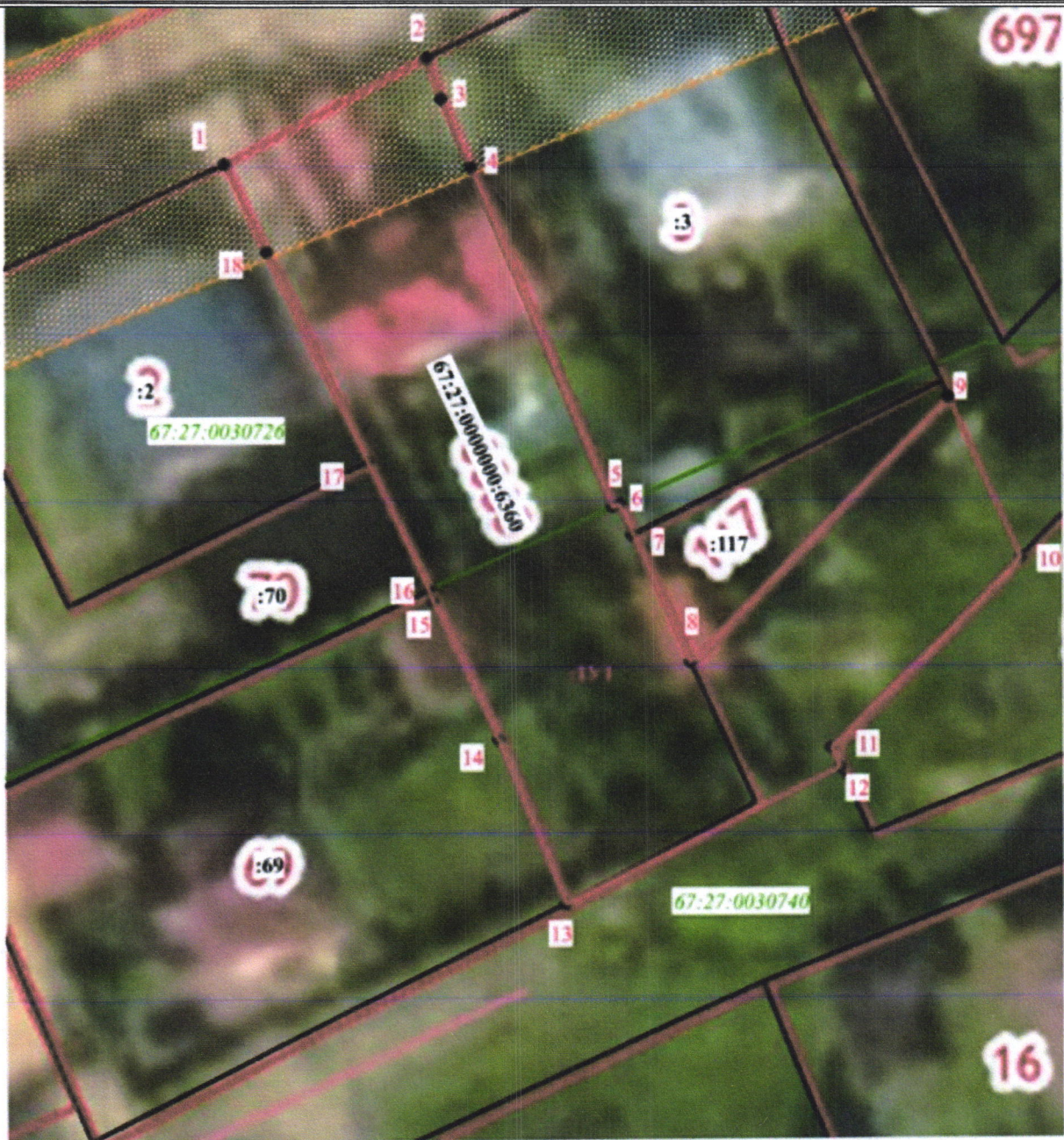
Схема расположения земельного участка или земельных участков на КПТ