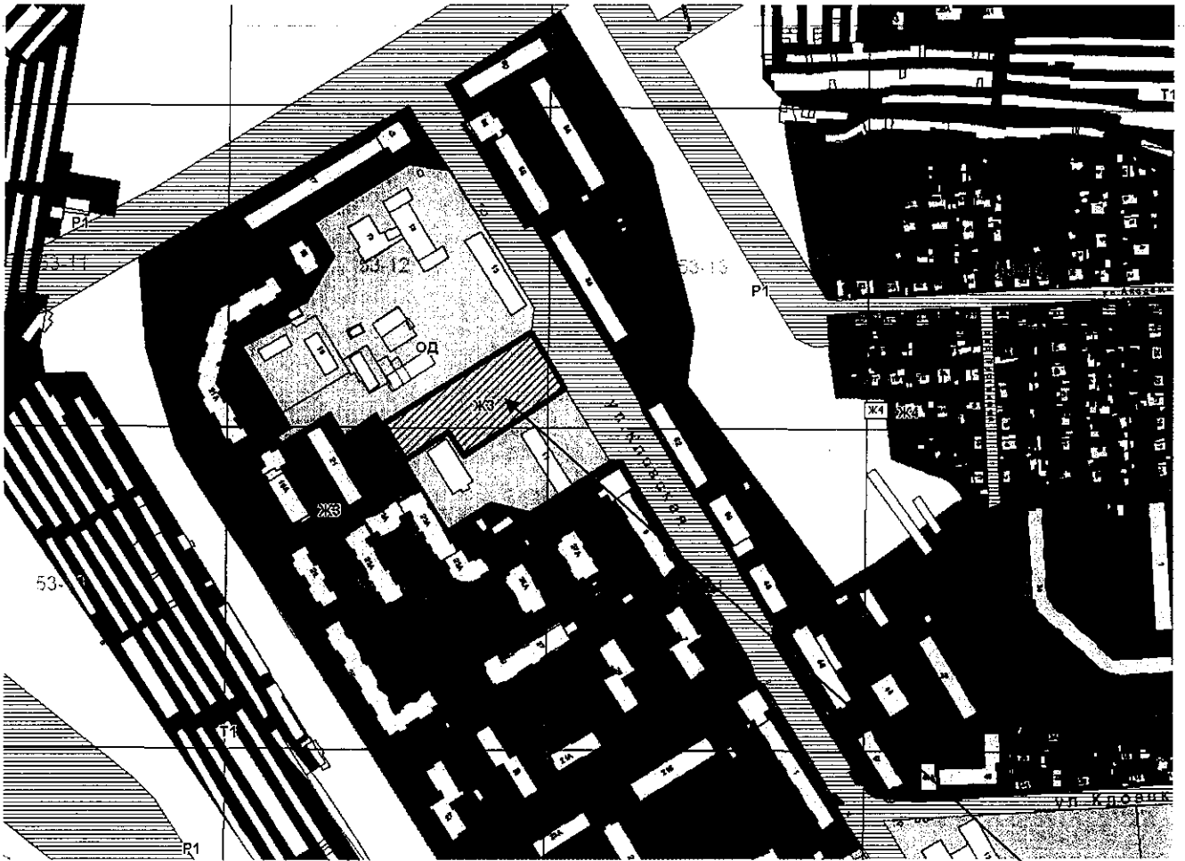
Схема расположения земельного участка по улице Кловской, 11а

Земельный участок площадью 6370 м 2 с кадастровым номером 67:27:0020464:24, включенный в границы территориальной зоны ЖЗ.