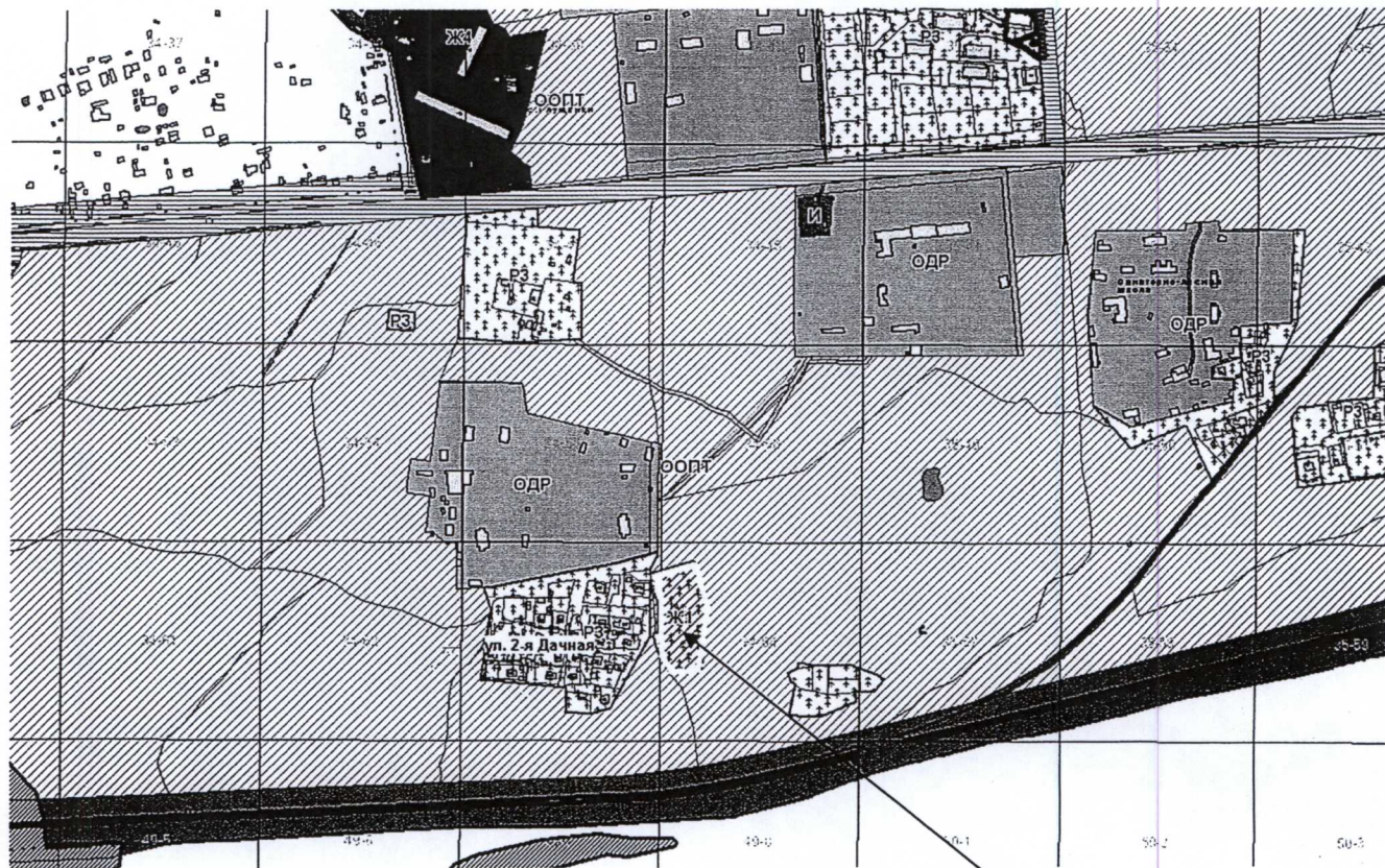
Схема расположения земельного участка в районе ул. 2-я Дачная

Земельный участок с кадастровым номером 67:27:0011212:32, включенный в границы территориальной зоны Ж1.