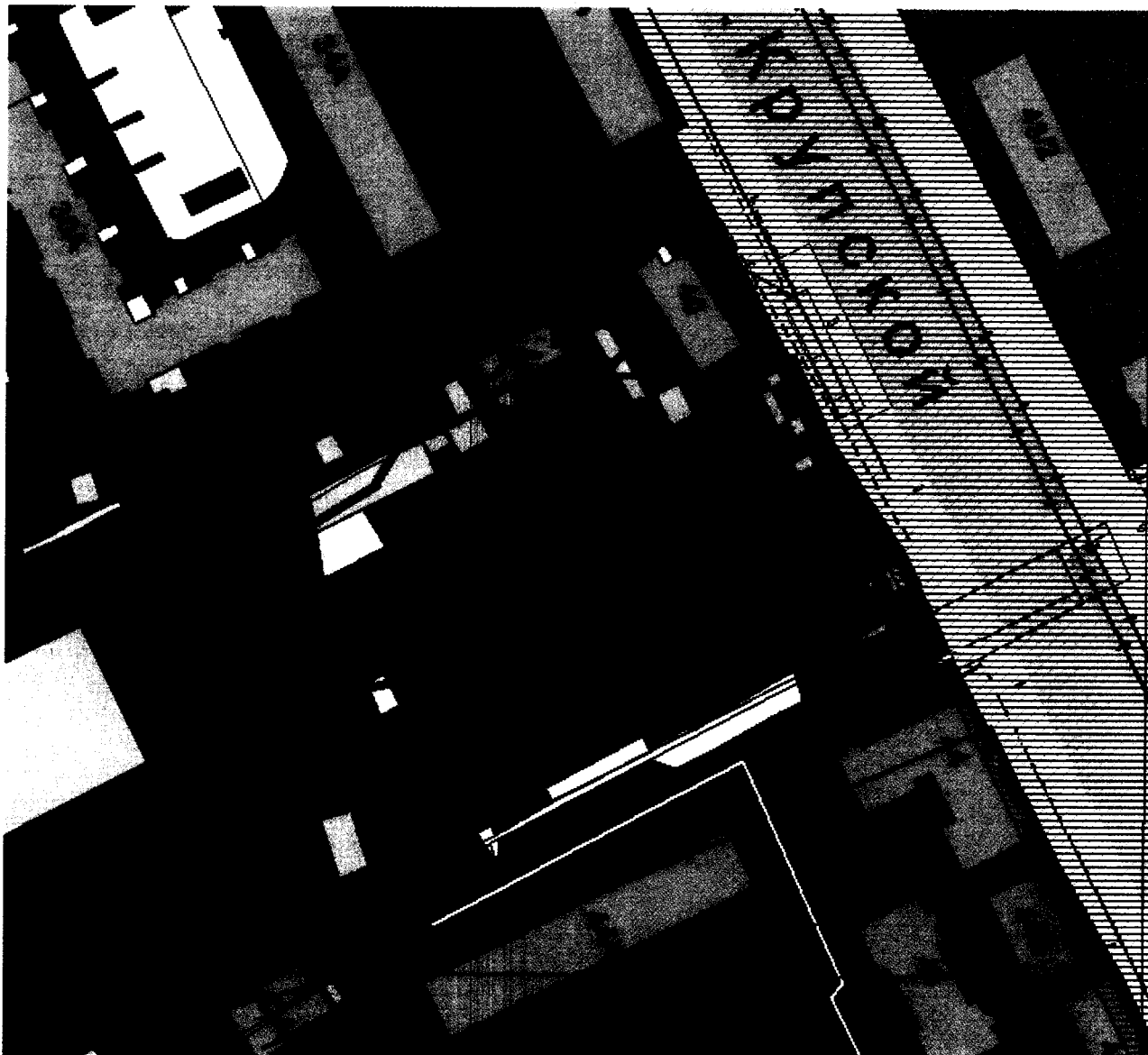
Схема расположения земельного участка с кадастровым номером 67:27:0030734:572 по адресу (иное описание местоположения): Российская Федерация, Смоленская область, город Смоленск, улица Крупской, дом 42